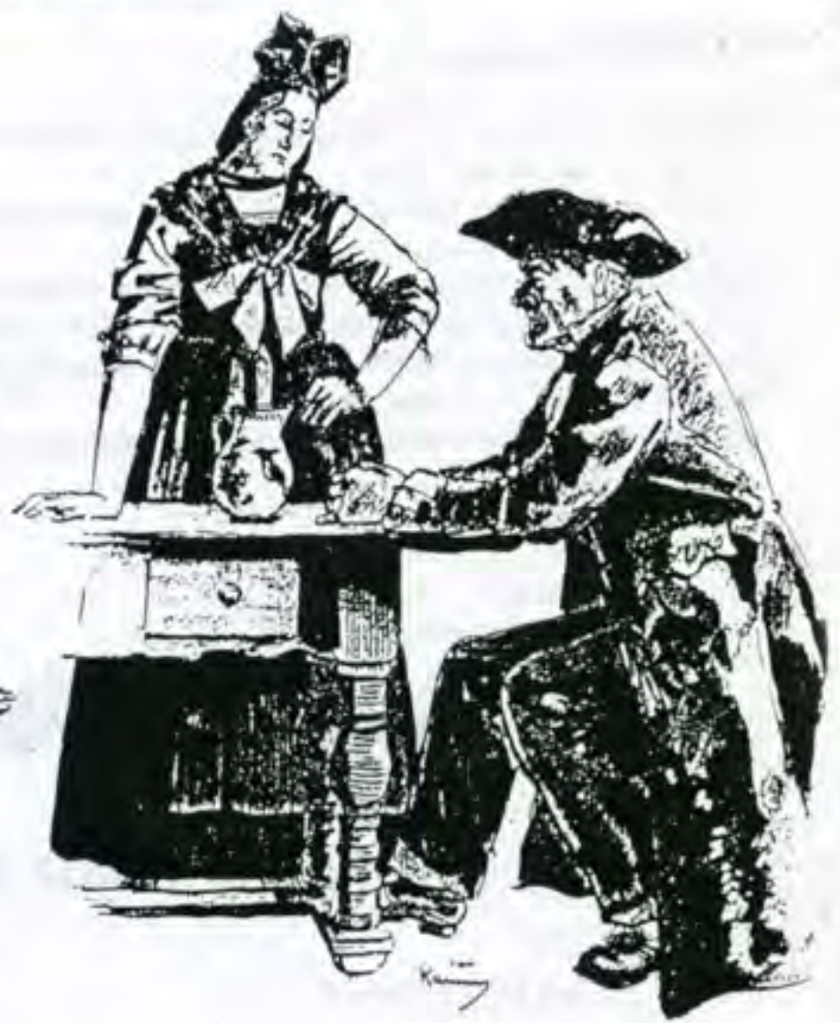
RÉGION DE WISSEMBOURG (Oberzack)