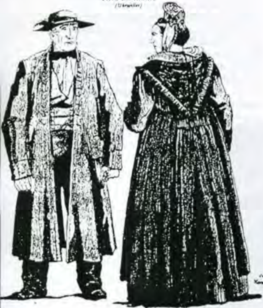
RÉGION DE WISSEMBOURG (Oberzack)