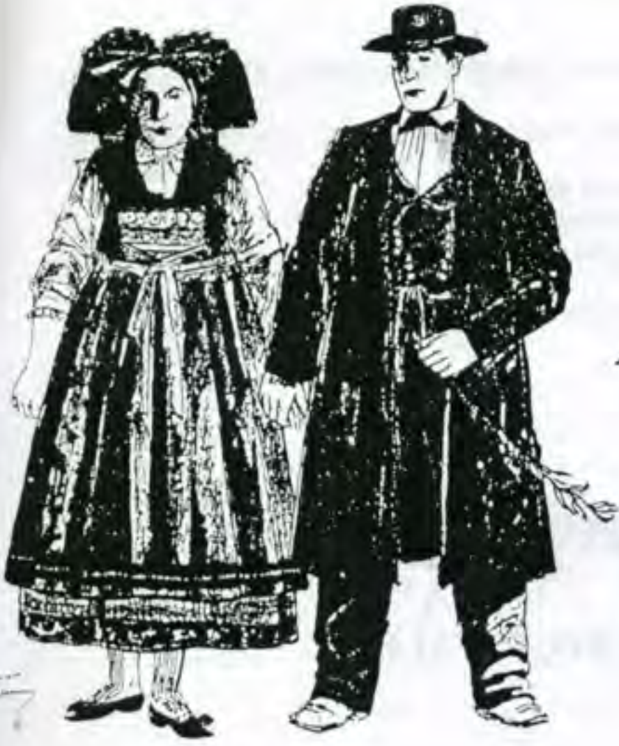
PAYS DE HANAU (Ukrainien)